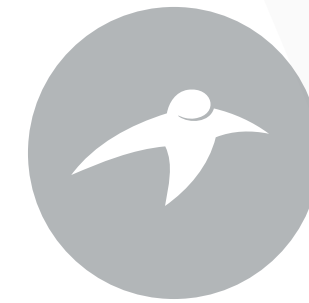
Vacature marketing & communicatie advies